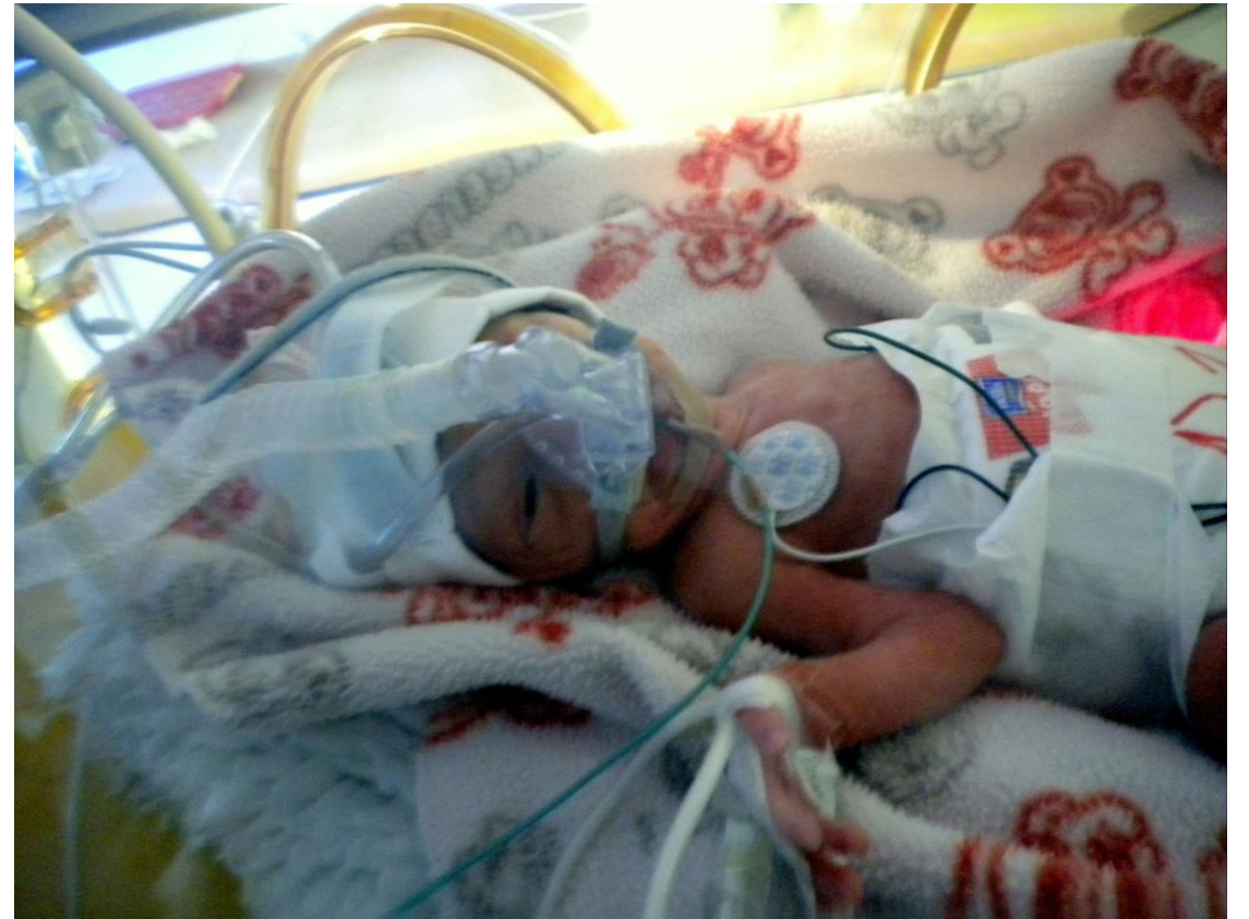
Eliška – 27tt., 905g