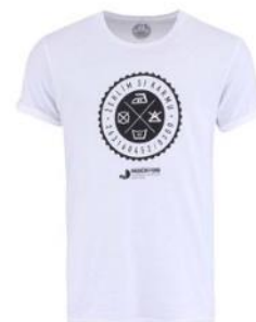
"Dobré" bílé pánské tričko pro Nadační fond pro předčasně narozené děti a