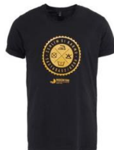
"Dobré" černé pánské tričko pro Nadační fond pro předčasně narozené