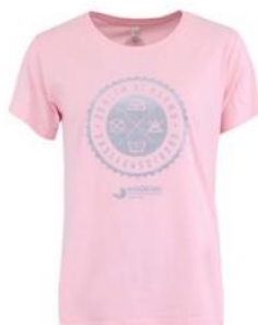
"Dobré" světle růžové dámské tričko pro Nadační fond pro předčasně