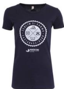
"Dobré" modré dámské tričko pro Nadační fond pro předčasně narozené